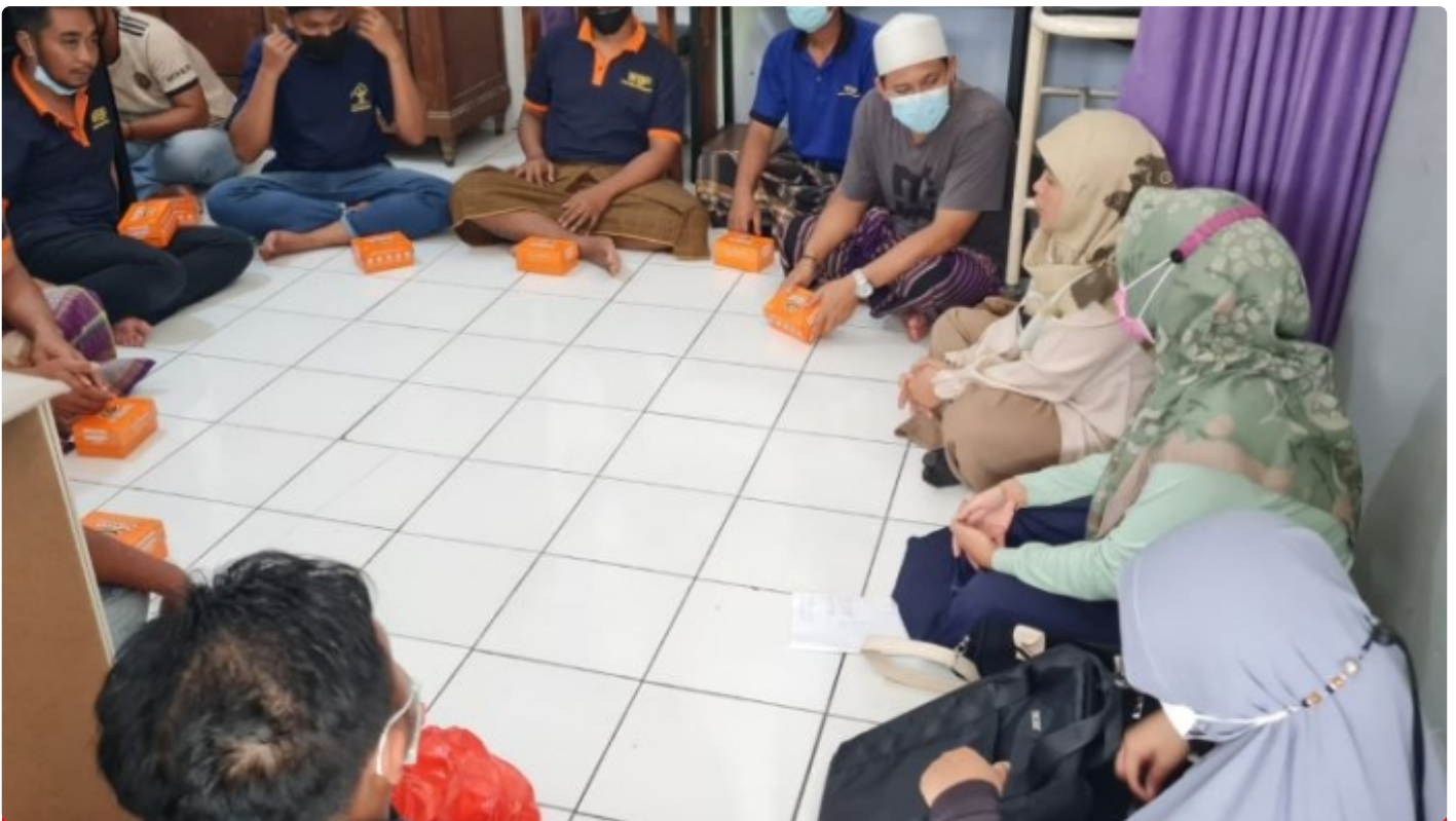
Psikolog UMS lakukan Observasi lanjutan kepada WBP Lapas Ambarawa

SEMARANG - Lapas Ambarawa menerima 4 Psikolog UMS sebagai Narasumber untuk melakukan Observasi kepada Warga Binaan Pemasyarakatan (WBP), Senin (25/10/2022).